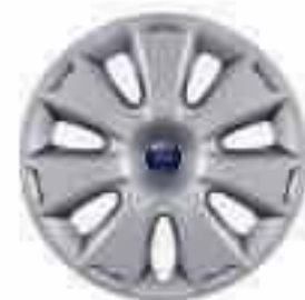
Capace roți de 16" cu 7x2 spițe (Dotare standard pentru modelul Trend)