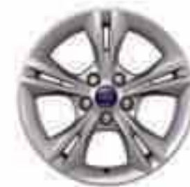
Jante din aliaj de 16" cu 5x2 spițe (Dotare standard pentru modelul Sport și accesoriu pentru toate celelalte modele)