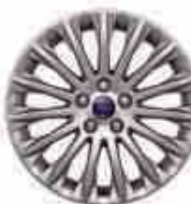
Jante de aliaj de 17" cu 15 spițe (Opțiune pentru Titanium și Sport și accesoriu)