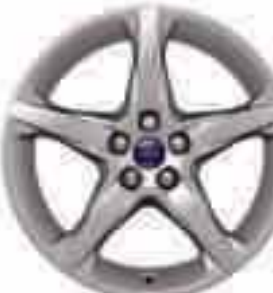
Jante de aliaj de 18" cu 5 spițe (Opțiune pentru Sport și Titanium și accesoriu)