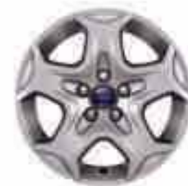
Jante model „Design” de 16" cu 5 spițe (disponibil în funcție de piața)