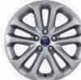
Jante din aliaj de 17" cu 5x2 spițe (Accesoriu)