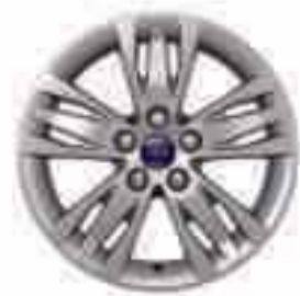
Jante din aliaj de 16" cu 5x3 spițe (Opțiune pentru Trend și accesoriu)