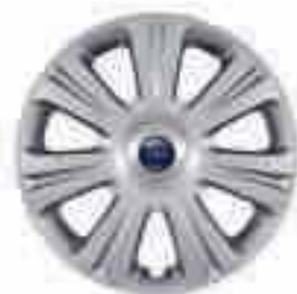
Capace roți de 16" cu 7 spițe (Dotare standard pentru modelul Ambiente)

O gamă largă de jante din aliaj proiectate special pentru liniile dinamice ale noului model Ford Focus.