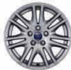
Jante din aliaj de 16" cu 7x2 spițe (Accesoriu) Cod articol 1710604