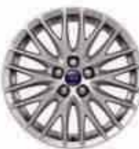
Jante din aliaj de 17" cu 11x2 spițe (Opțiune Trend, Sport și Titanium)