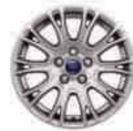
Jante din aliaj de 16" cu 11x2 spițe (Dotare standard pentru modelul Titanium)