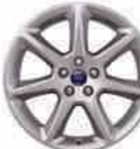
Jante din aliaj de 18" cu 7 spițe (Accesoriu) Cod articol 1702126

Modelul prezentat este Ford Focus Titanium cu vopsea metalizată Candy Red (opțiune) și jante din aliaj de 18" cu 5 spițe (opțiune și accesoriu).