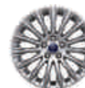
Jante aliaj 17" (opțional pentru Titanium)