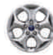
Jante de aliaj 16" (opțional pe Trend)