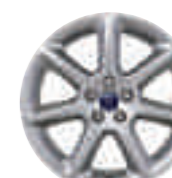
Jante aliaj 18" (opțional pentru Titanium)

Notă Jantele de 18" disponibile pe Ford C-MAX sunt concepute pentru a oferi mai multă sportivitate și o calitate a condusului îmbunătățită, comparativ cu jantele de 16" și 17".