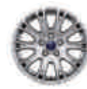
Jante aliaj 16" (standard pentru Titanium)